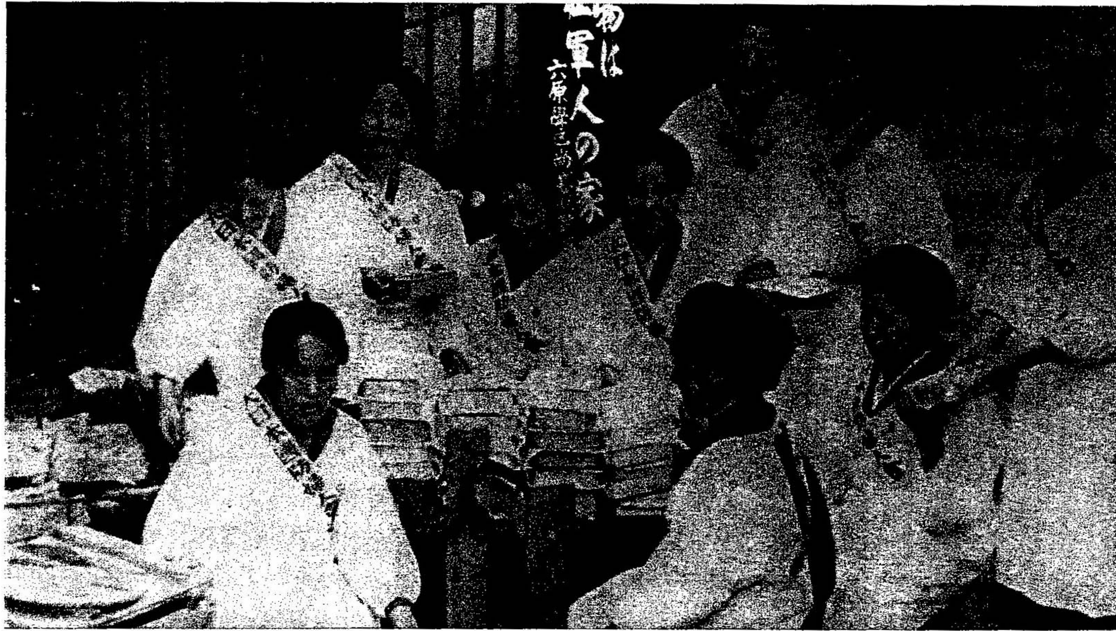
国防婦人会 報国会，青年団，婦人会と，職場でも家庭でも，戦争協力体制がおしすすめられた