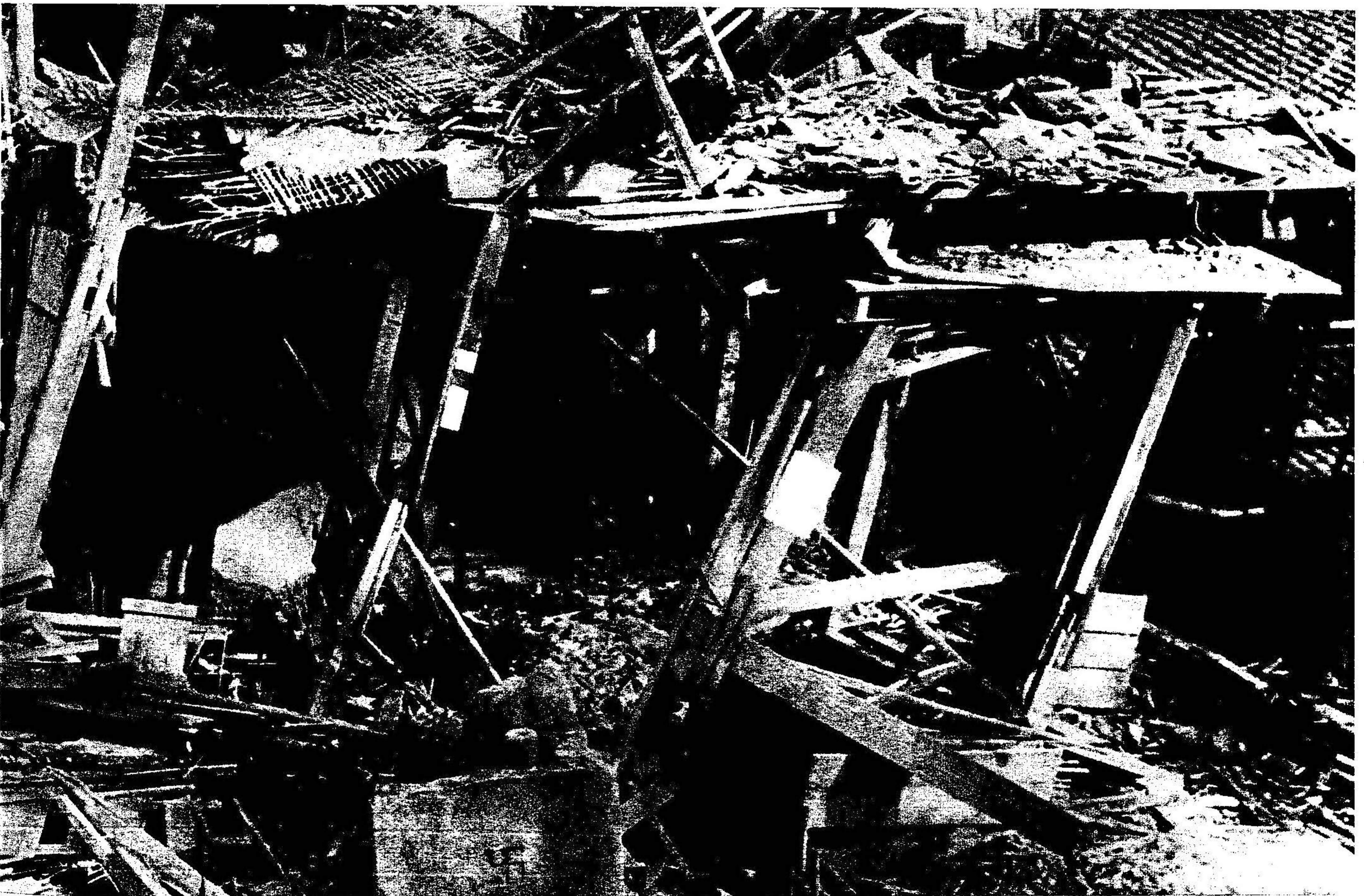
京都は，市内，山城方面の各地で15回の空襲をうけた