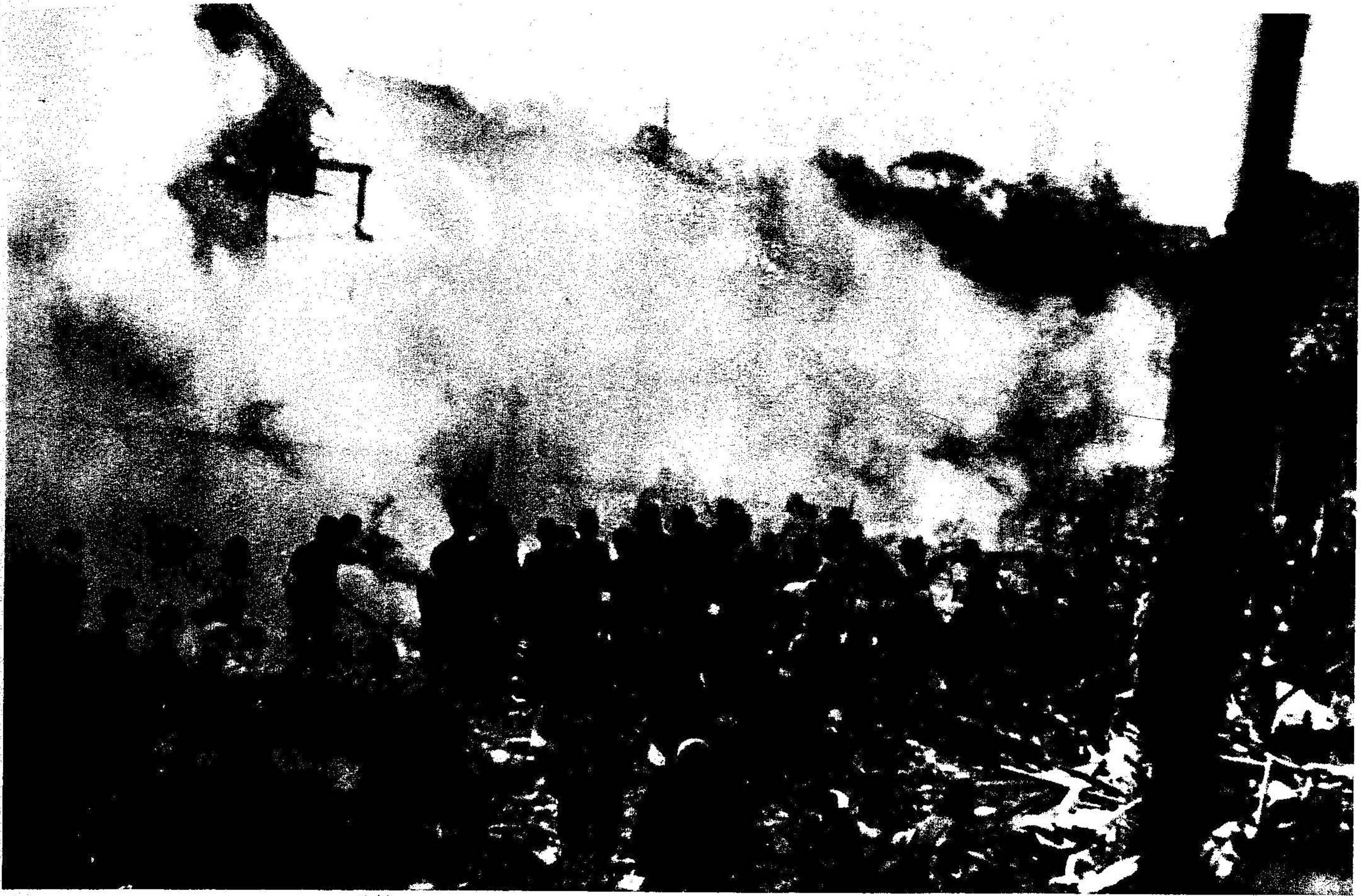
昭和20年1月26日夜，京都市東山区馬町に爆弾、焼夷弾が投下され，死傷者90名，全半壊家屋44軒をだした